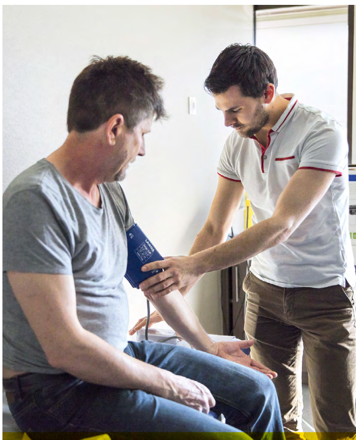
La consultation, d'un montant de 25 euros, est remboursée par l'Assurance maladie.